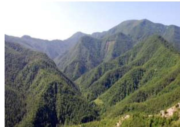
Alpe della Luna